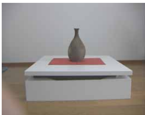
Advanced三次元免震台（特開2007 - 170561）