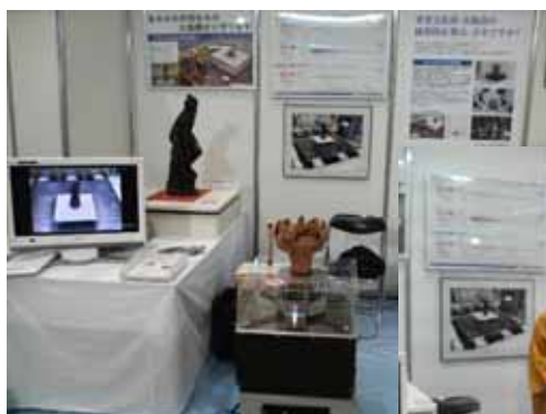
大阪ビジネスEXP02008 平成20年5月 (東京ビッグサイト)