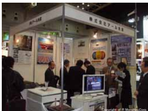
第12回震災対策技術展 平成20年1月 (パシフィコ横浜)